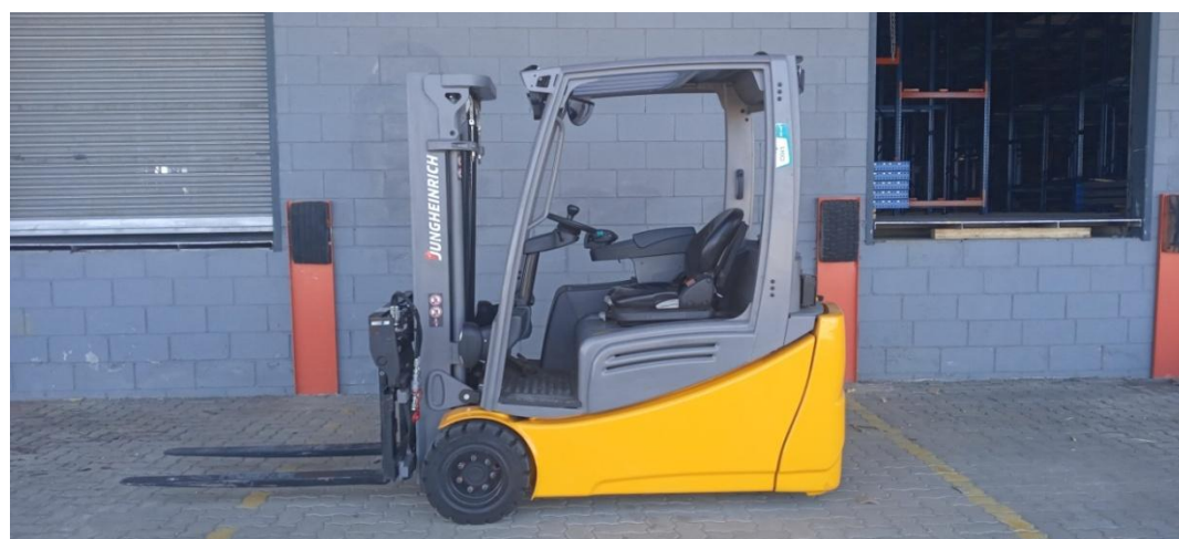
Figura 6. Empilhadeira elétrica.