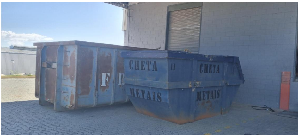
Figura 12. Área de armazenamento temporário de resíduos.