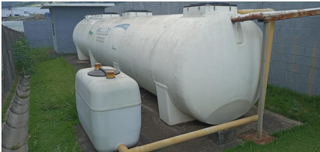
Figura 13. Estação de tratamento de efluentes sanitários.