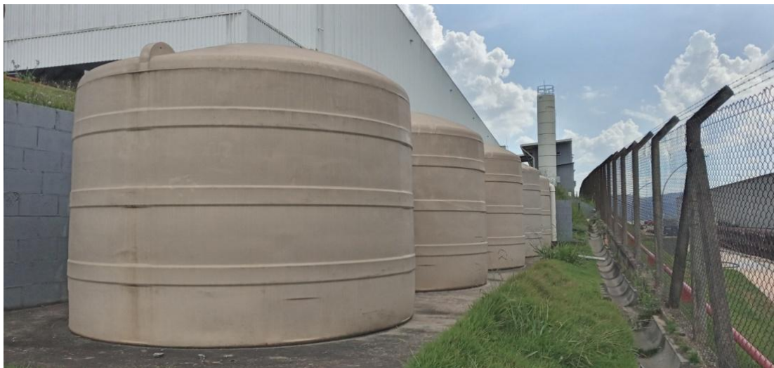
Figura 14. Tanques de retardo de águas pluviais.