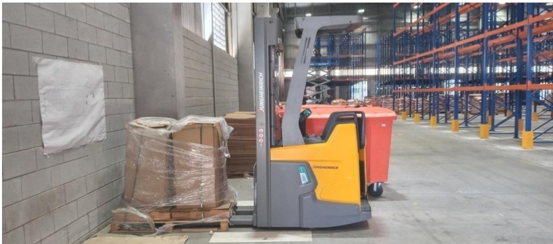
Figura 7. Empilhadeira elétrica retrátil.