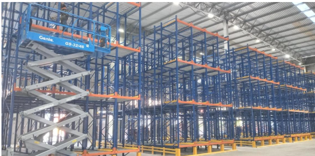
Figura 4. Visão geral da área de estocagem 1.