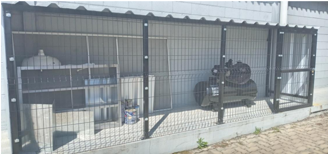
Figura 11. Área de compressor.