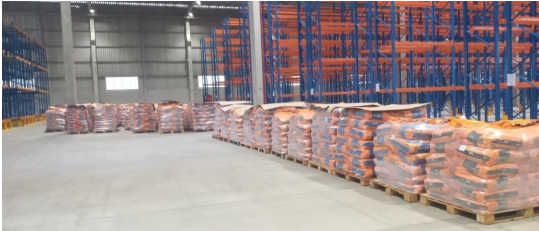
Figura 10. Sacos de ração paletizados e estocados até instalação nas posições porta-paletes.