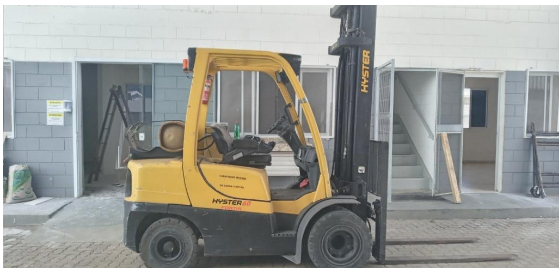
Figura 9. Empilhadeira contrabalançada.