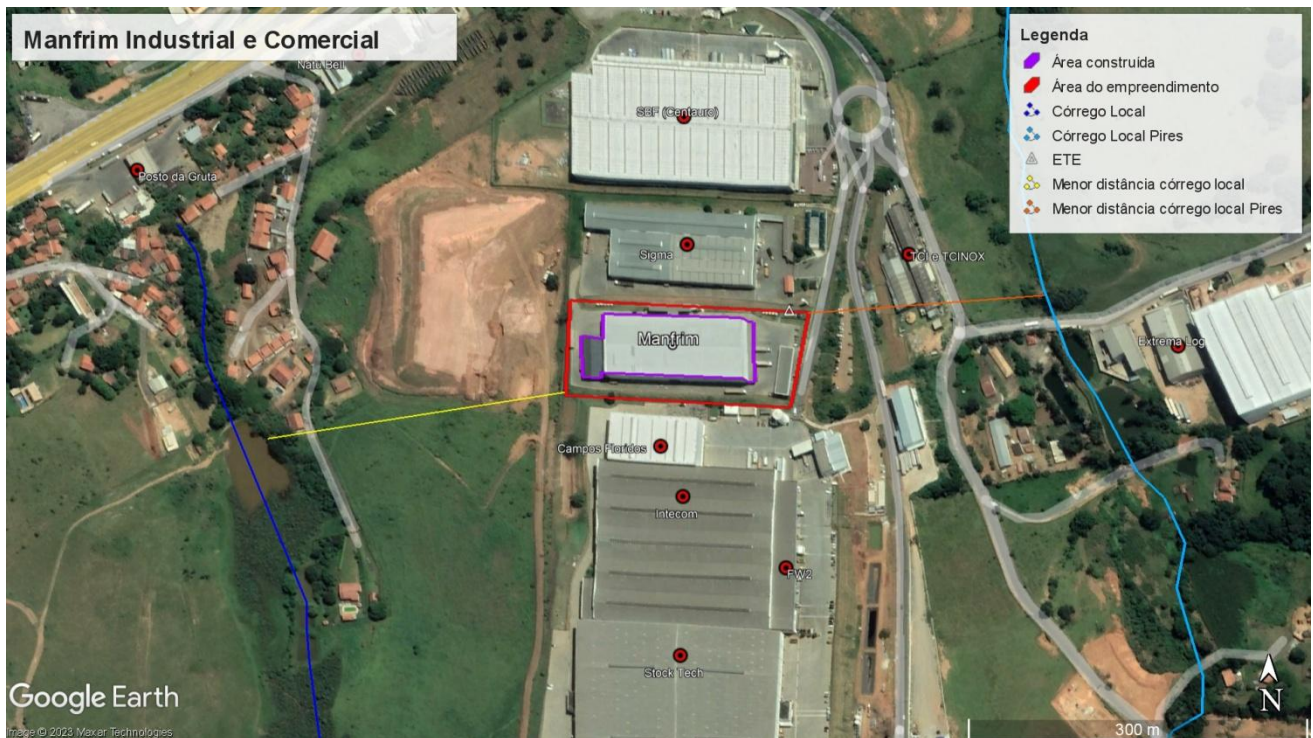
Figura 2. Localização do empreendimento.