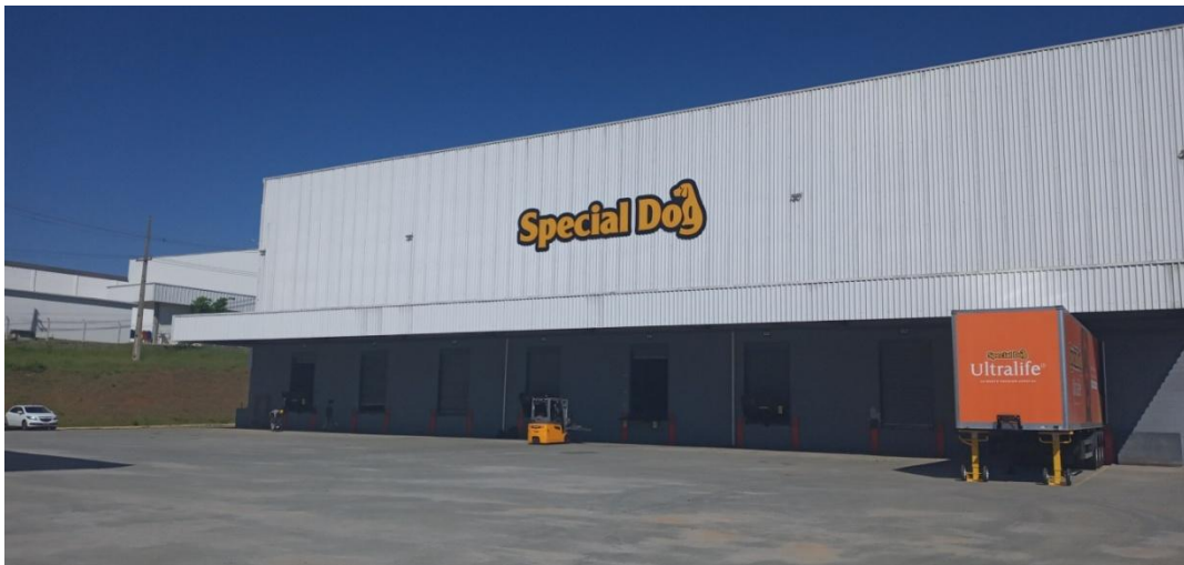
Figura 1. Visão geral da fachada do empreendimento.