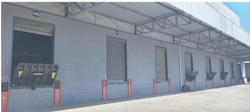
Figura 2. Docas de expedição.