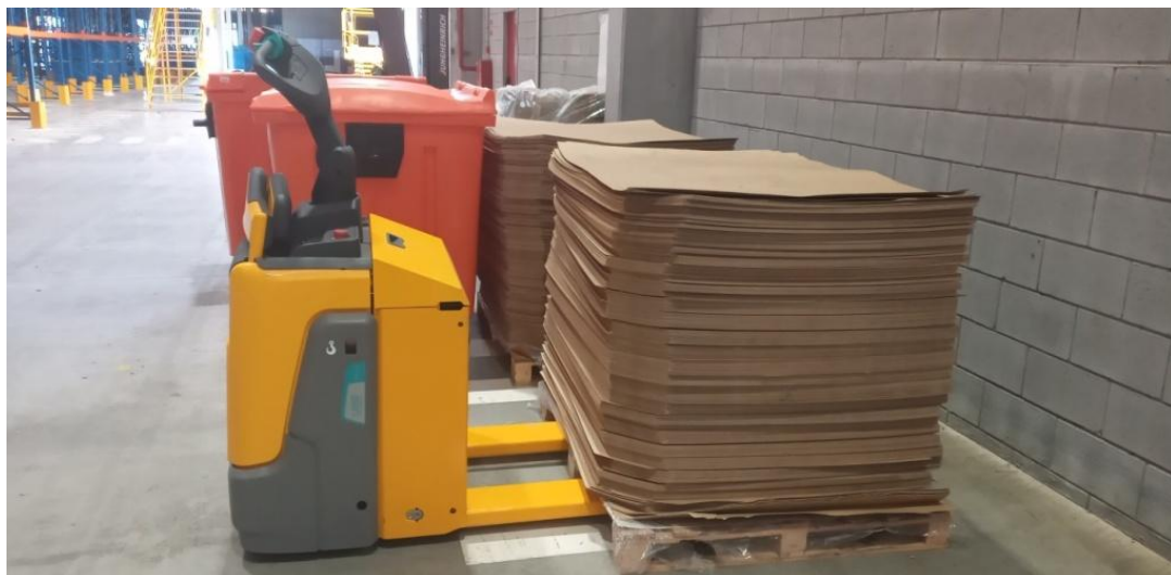
Figura 8. Empilhadeira patolada.