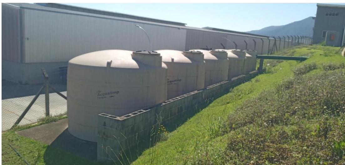
Figura 15. Tanques de retardo de águas pluviais - anteriormente ao lançamento de vazão aos fundos do terreno e sistema de drenagem da via local.