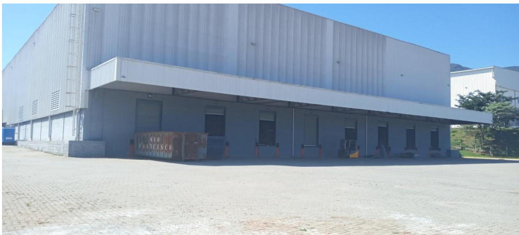
Figura 3. Docas de recebimento.