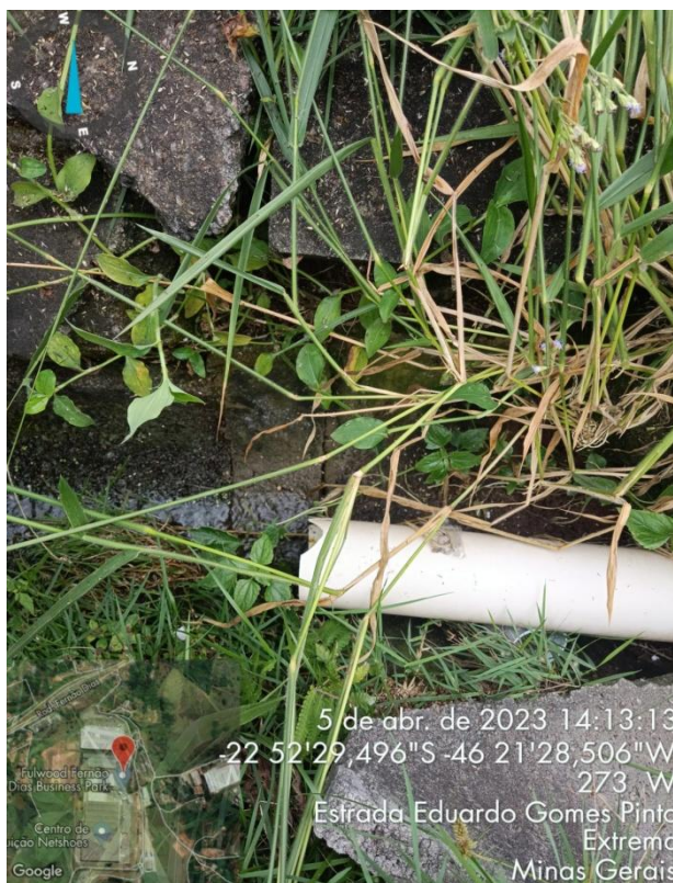
Figura 16. Lançamento do efluente tratado na galeria de águas pluviais do empreendimento.