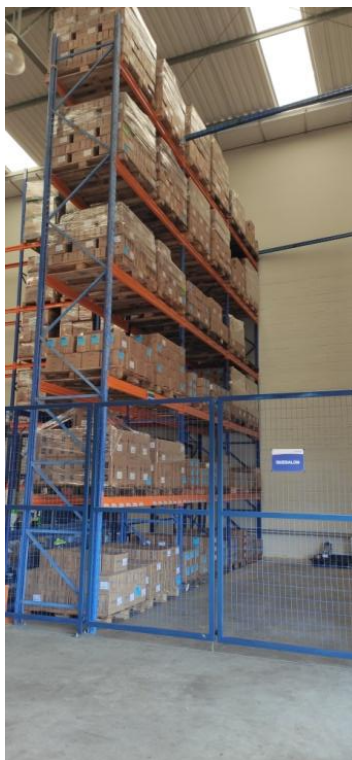
Figura 1. Área de estocagem da Quesalon (área exclusiva).