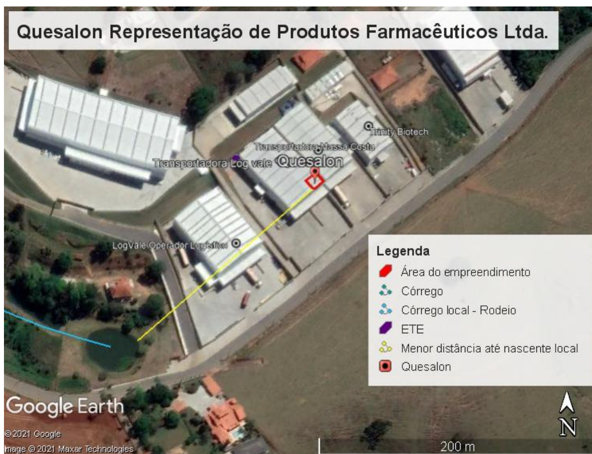
Figura 2. Localização do empreendimento.

Com relação à vegetação, observam-se campos antrópicos (pastagens) na região, além de remanescentes florestais, indústrias e residências no entorno. Em análise às imagens de satélite da área (Figura 2), verifica-se que a menor distância da empresa à nascente do córrego local é de cerca de 160 metros.