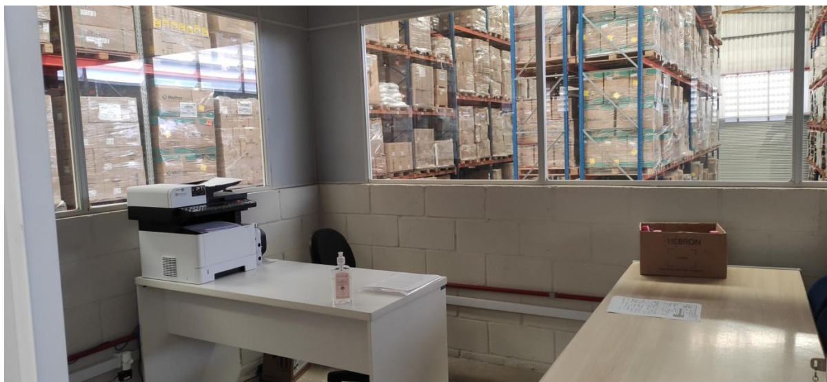
Figura 6. Vista interna escritório da Quesalon (área exclusiva).