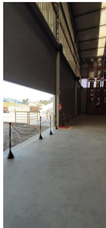
Figura 4. Vista interna da área de recebimento/expedição (área comum).