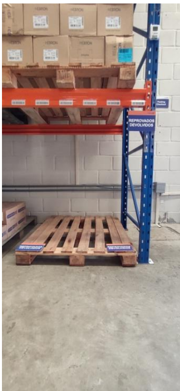
Figura 3. Área denominada Reprovados/ Devolvidos (área exclusiva).