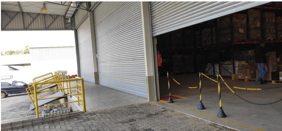
Figura 5. Vista externa da área de recebimento/expedição (área comum).