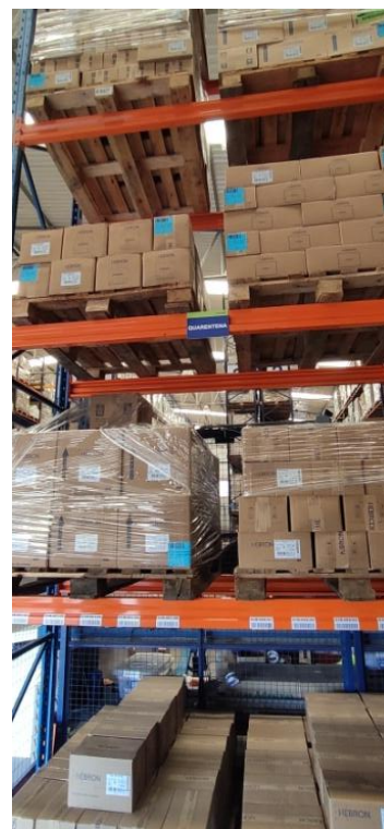
Figura 2. Área denominada Quarentena (área exclusiva).