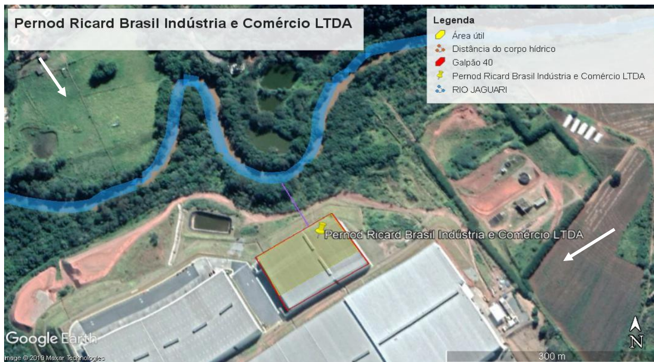
Figura 2. Localização do empreendimento.